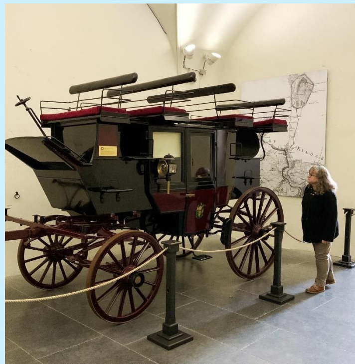
Каретата Collon в Касълтаун Хаус, Co. Kildare

Дейностите по разказване на истории насърчават личното изразяване. Въпреки че не разчитат на спомени, ако участник иска да си припомни нещо от миналото, това се насърчава.